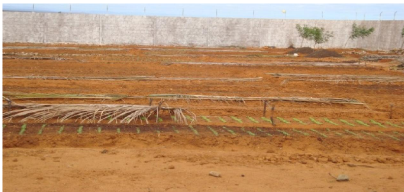
Figura 3. Germinação de hortaliças orgânicas

para que pudessem chegar ao mercado consumidor em bom estado de conservação e maturação. A seleção atenderá às exigências do mercado. As que não apresentarem condições suficientes para comercialização in natura foram enviadas ao Instituto para processamento no setor de agroindústria e elaboração de pasta de alho, extrato de tomate, molho de pimenta e legumes em conserva prevista nos materiais e métodos.