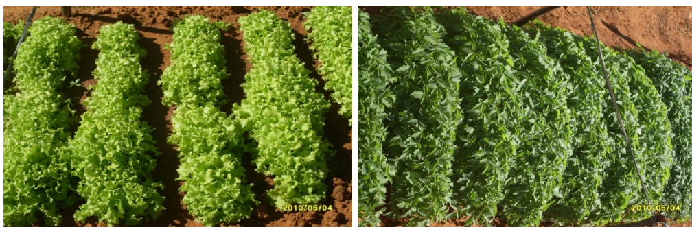
Figura 4. Hortaliças prontas para comercialização