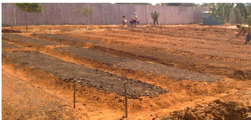
Figura 2. Adubação orgânica e irrigação manual

Na marcação dos canteiros, utilizaram-se ferramentas, como enxada, barbante, piquetes, trema e maretas. Logo após, iniciou-se o levantamento dos canteiros, medindo 1.20x10m sendo que a distância entre um canteiro e outro é de 50 cm de distância para facilitar o manejo de irrigação e os tratos culturais. Feito o canteiro, deu-se início a adubação orgânica com esterco bovino cortido. As olerícolas foram semeadas após a adubação com 15l/m 2 de esterco de bovino e coberto com palha de coco para proteção ao germinar. As mudas foram transplantadas no espaçamento de 0.20mx 0.20m aos 28 dias após o semeio (Figura 2).