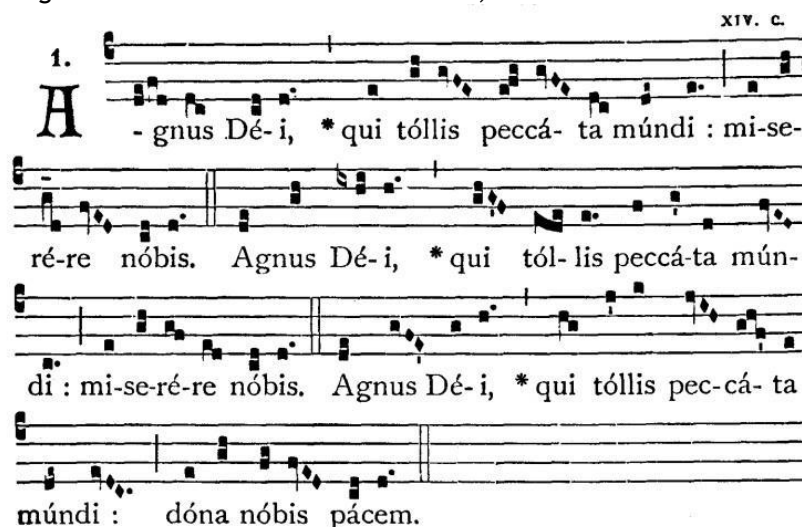
Figura 7: Agnus Dei de manuscrito do século XIV, retirado do Lieber Usualis (1961).

Destacamos, também, o uso da pauta de quatro linhas com Clave de Dó na quarta linha 5 . Nesta notação, levando em consideração a clave utilizada e sua posição, temos o Ré, nota finalis do modo utilizado, na primeira linha, na qual a melodia conclui ao final de cada frase, imediatamente antes de cada barra dupla de compasso, utilizando o empréstimo do termo contemporâneo para ilustração. O Agnus Dei resgatado de manuscrito do século XIV encontra-se ilustrado a seguir.