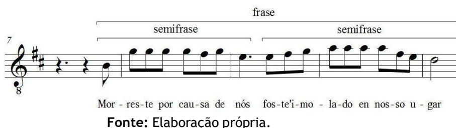
Figura 2: Segundo trecho em O cordeiro de Deus.

Logo em seguida encontra-se uma frase musical composta por duas semifrases, conforme ilustrado na Figura 2: