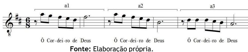
Figura 1: Início de Ó Cordeiro de Deus.